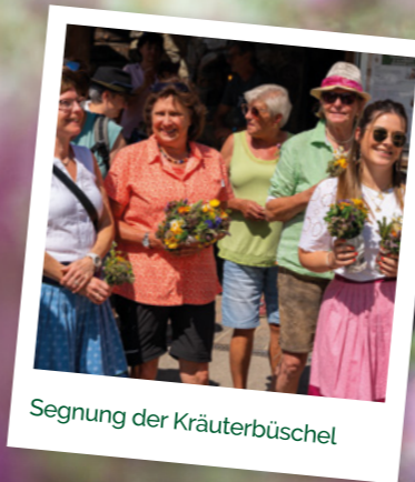
Segnung der Kräuterbüschel