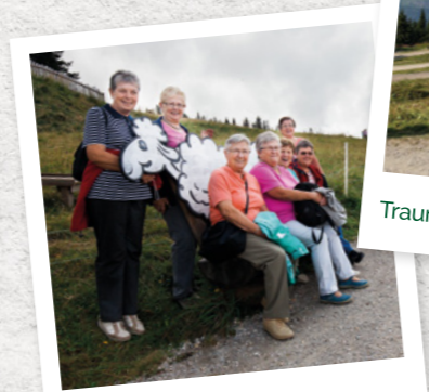
Wanderverspaß für alle

Ein einheimischer Wanderführer erzählt Ihnen Wissenswertes über die Geschichte, Entwicklung der Schafalm Planai und über die Region Schladming-Dachstein.