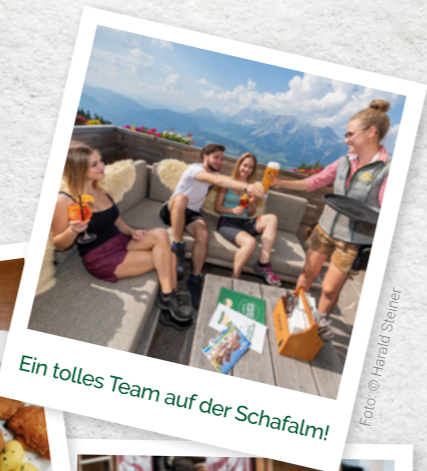
Ein tolles Team auf der Schafalm!