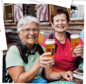
... und vor allem viel Gemütlichkeit