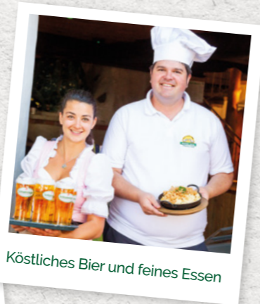
Köstliches Bier und feines Essen